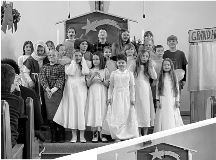
Krippenspiel in der Trinitatiskirche in Sedelsberg Sowohl bei der Generalprobe mit Adventscafé am Freitag vor Weih- nachten als auch am Heiligabend

überzeugten die Kin- der mit ihrer Suche nach dem Weihnachts- klang.