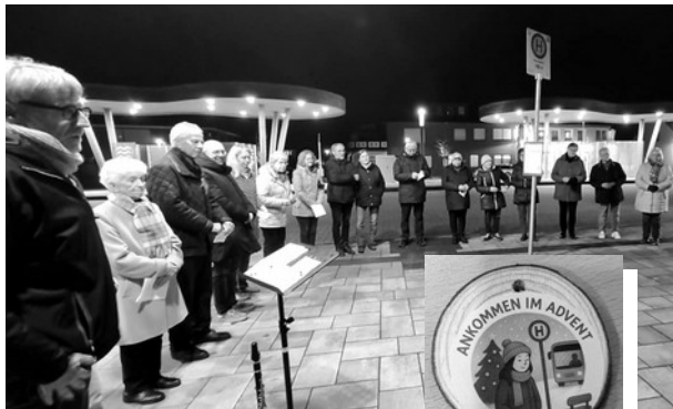
oben: Ökumenischer Arbeitskreis am Busbahnhof in Friesoythe

Lebendiger Adventskalender unten: Vor der Auferstehungskirche in Bösel. Der „Prophet Sacharja“ erzählt den Menschen von dem König, der kommt, aber so ganz anders ist als die Erwartungen der Menschen.